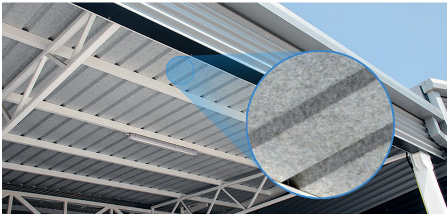
Types de profilage